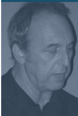
Guillermo Vázquez Consuegra Edificio per Case Popolari Rota (Cadice) – Spagna

L'edificio di Case popolari progettato in un'area di espansione al nord di Rota (Cadice) è risultato vincitore di un concorso nazionale bandito dalla Junta de Andalucía. Si tratta di un blocco composto da 90 appartamenti che occupa il lotto terminale di un insediamento di residenze a basso costo regolato da un piano particolareggiato che prevedeva una conformazione a patio per gli isolati che lo costituivano.