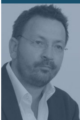
Kís Péter Építészműterme Práter Street Social Housing Budapest – Ungheria

L'edificio è inserito all'interno del denso tessuto residenziale del secolo scorso della città di Budapest assumendo la scala e gli allineamenti degli edifici circostanti come tema di progetto. Il proposito esplicito di non imporre la propria presenza in maniera evidente sulla cortina edilizia, composta da edifici di minore dimensione rispetto alla parcella di progetto, è affrontato attraverso la frammentazione dell'intervento in due differenti volumi. Questi, da un lato si appoggiano al muro tagliafuoco seguendo la forma dell'edificio confinante, dall'altra completano con un nuovo quarto lato una corte interna all'isolato. La facciata del corpo più lungo è arretrata rispetto al filo stradale in modo da lasciare un generoso spazio pubblico alla città. Il varco tra i due corpi si apre sul giardino interno, permettendo la vista dei grandi alberi dal marciapiede esterno. I due volumi sono tra loro collegati da esili ponti in cemento, che continuano ai diversi piani i ballatoi interni e divengono l'elemento caratterizzante l'intero intervento.